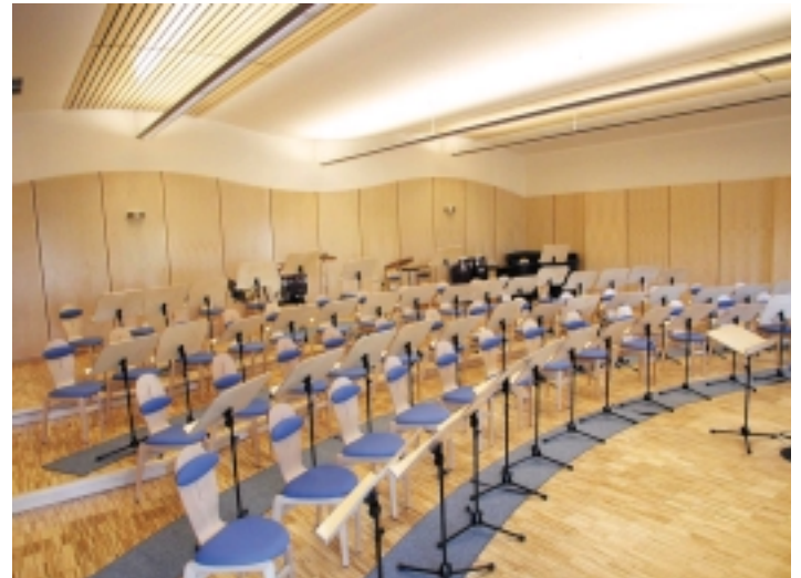
Form und Funktion im Einklang

nug? Wird er mit mir zufrieden sein? Ich bin – Oliver ist.